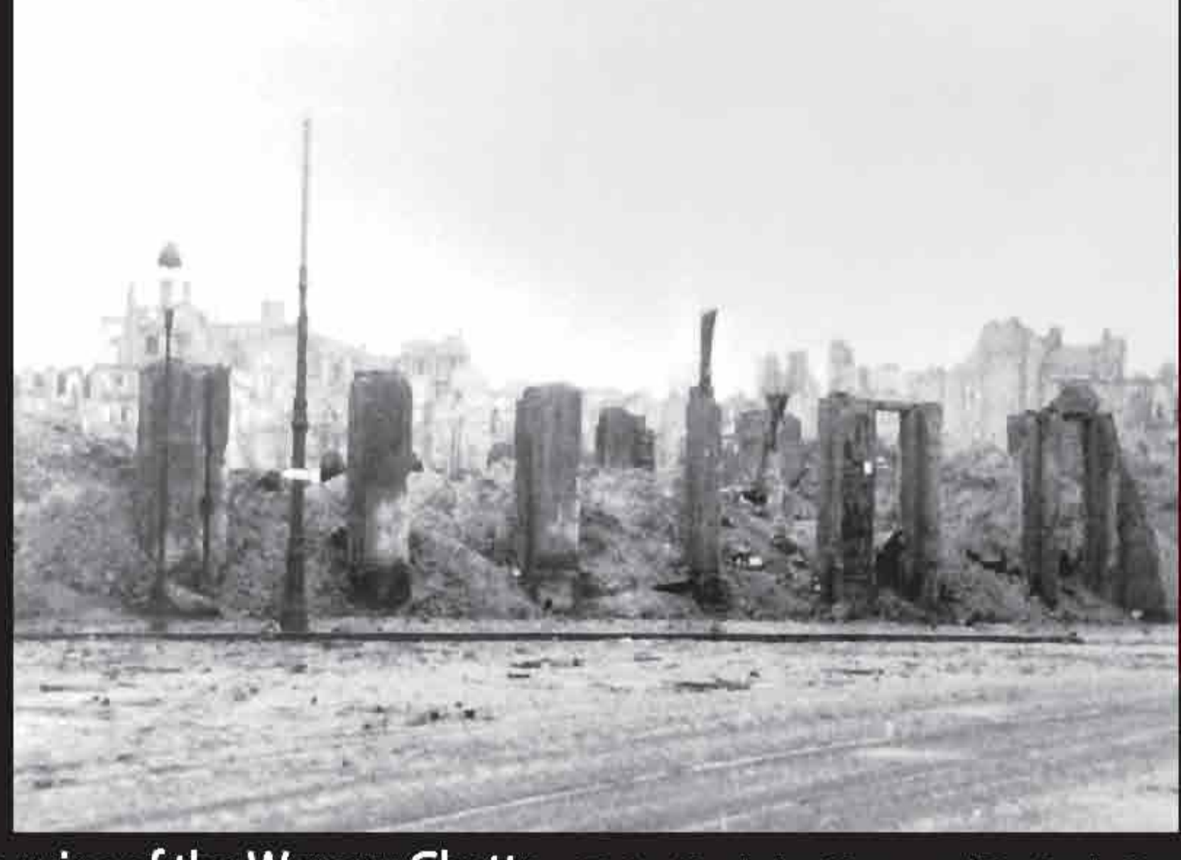
The ruins of the Warsaw Ghetto.

"THE JEWISH QUARTER OF WARSAW IS NO MORE!"