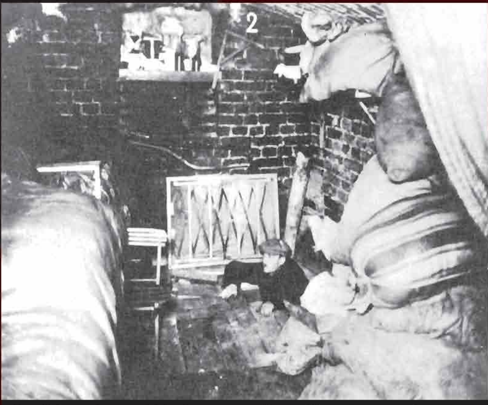
Jewish resistors hide in camouflaged bunkers and sewers during the ghetto revolt.

"They [the Jewish Fighting Organization] considered it a victory if a part of those imprisoned in the ghetto were able to escape; it was a victory in their eyes if the forces of the enemy were weakened just a little; and finally, it was a victory in their eyes to die while their hands still grasped arms."