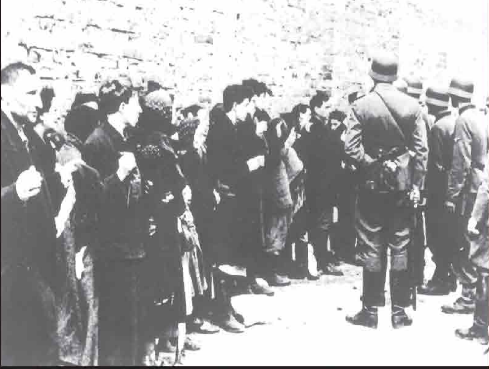
Inhabitants of the Warsaw Ghetto are arrested during the 1943 uprising.

จากรายงานเรื่อง "ไม่มีชุมชนยิวเหลืออยู่ในวอร์ซอว์" โดยนายพลชตรูป