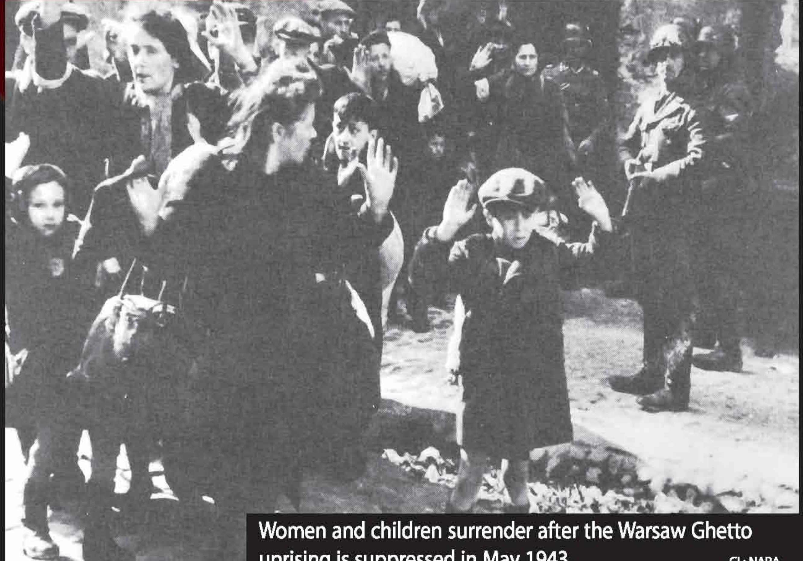
Women and children surrender after the Warsaw Ghetto uprising is suppressed in May 1943.

DESPERATE AND WITH FEW WEAPONS, THE REMAINING JEWS OF the Warsaw Ghetto rose in revolt on the eve of Passover, April 19, 1943. For the first time, the entire ghetto resisted the Nazis—those who had arms fought, and even those without arms refused to surrender and improvised Molotov cocktails and other weapons. For three weeks the ghetto's inhabitants held out, until SS General Jürgen Stroop ordered the burning of the ghetto to force out all resistors and remaining inhabitants. After the war, Stroop was tried, sentenced and hanged for "crimes against humanity" committed during the destruction of the Warsaw Ghetto.