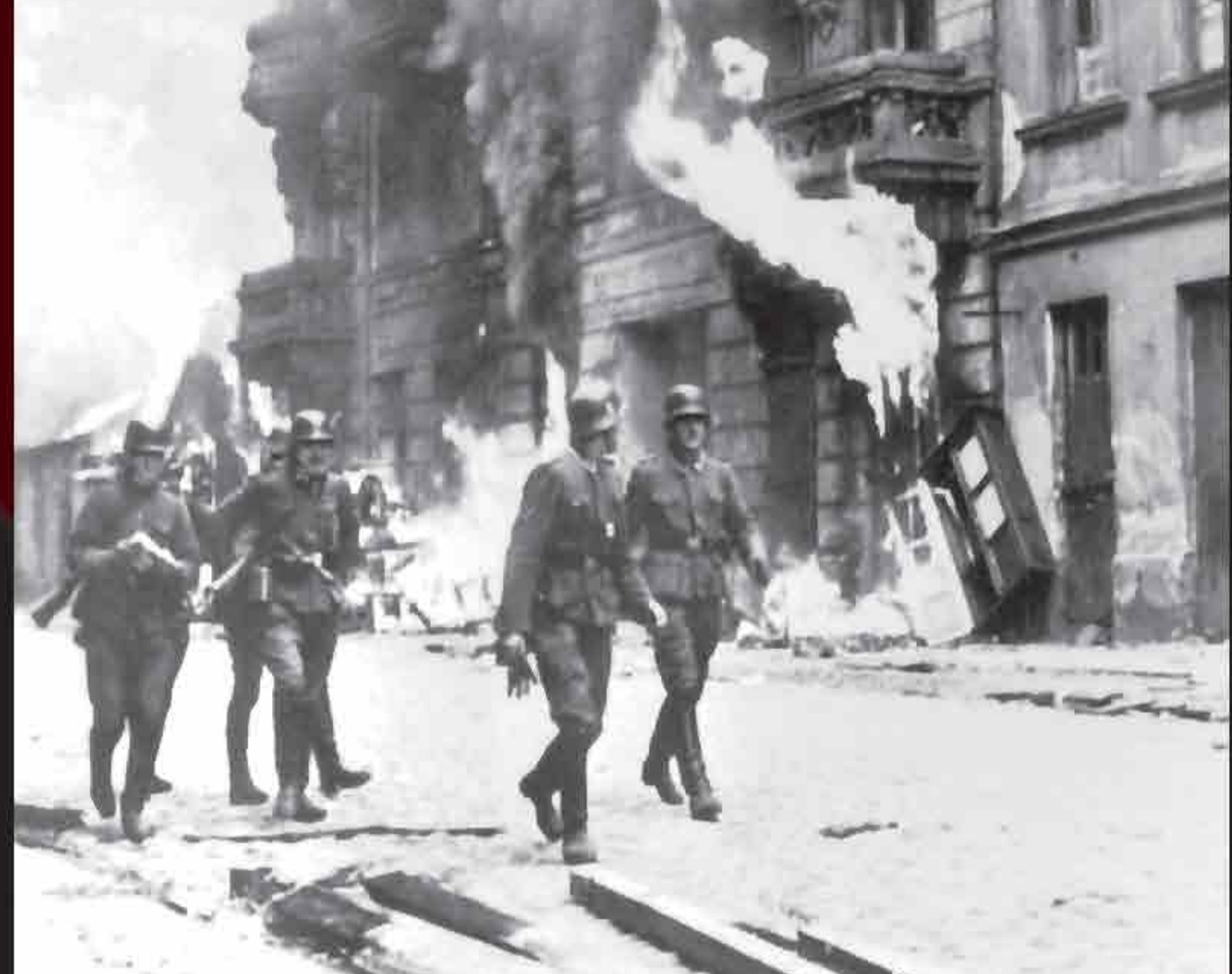
German soldiers and SS patrol Warsaw Ghetto streets after the uprising in May 1943.